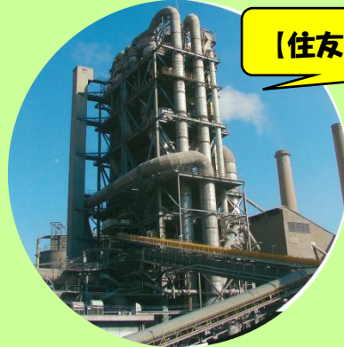
【住友大阪セメント岐阜工場】

普段は入れないセメント工場を見学！ セメントがどのようにできるか 製造過程を見学します。