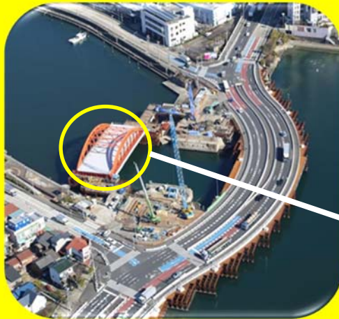
【名古屋港区 中川橋】