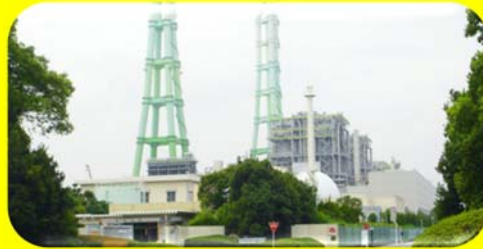
【中部電力 知多火力発電所】