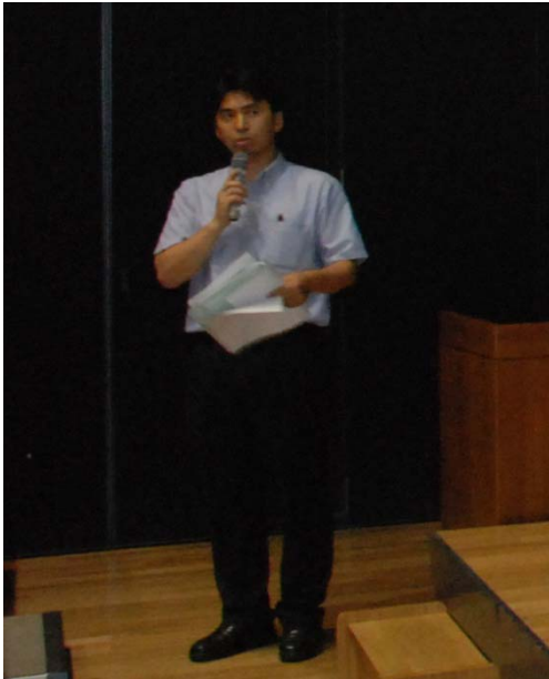
前田部会長(名工大)による 開催挨拶