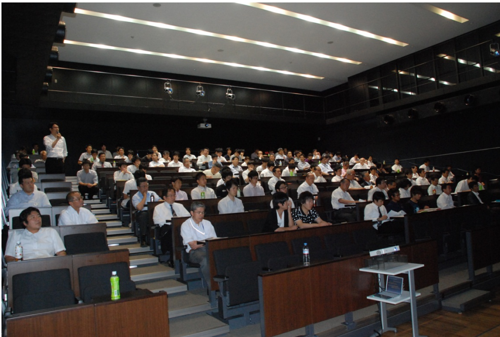
つめかけた聴衆のみなさん